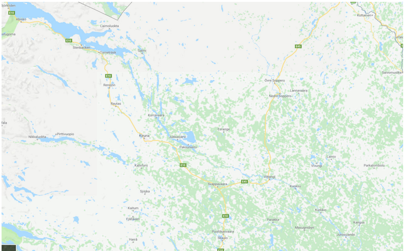
Här utspelar sig boken, du ser Kiruna på båda kartorna.