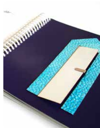
En taktil bild av ett hus i boken Rundis och Randis vill leka .

Figurerna Rundis och Randis letar efter sin kompis och knackar på i stora och små hus, där de möter vänner i olika former. Här erbjuder bilderna mer variation än i Badutflykten och Vanten . De är fortfarande mycket enkla, men består av olika former och material.