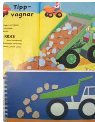
Ett och samma uppslag i två varianter av Jobba, jobba jämt , originalboken och den taktila bilderboken.

Även om bilderna innehåller många detaljer som först kan verka svåra att avläsa taktilt, är det viktigt att komma ihåg vad som gör det möjligt att känna igen en figur. Det är först och främst formen, den form som bildas genom föremålets konturlinje.