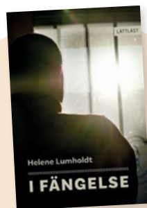
Boken är skriven på lättläst Nivå 2 (av 3) och ges ut 14 september.

hamnade tidigt utanför och kände sig misslyckad. För att känna sig tuff och stark började han begå små brott som sedan blev större brott.