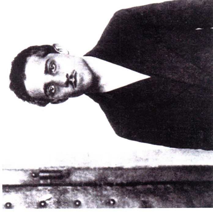
Gavrilo Princip var bara 19 år gammal när han hamnade i fångelse.