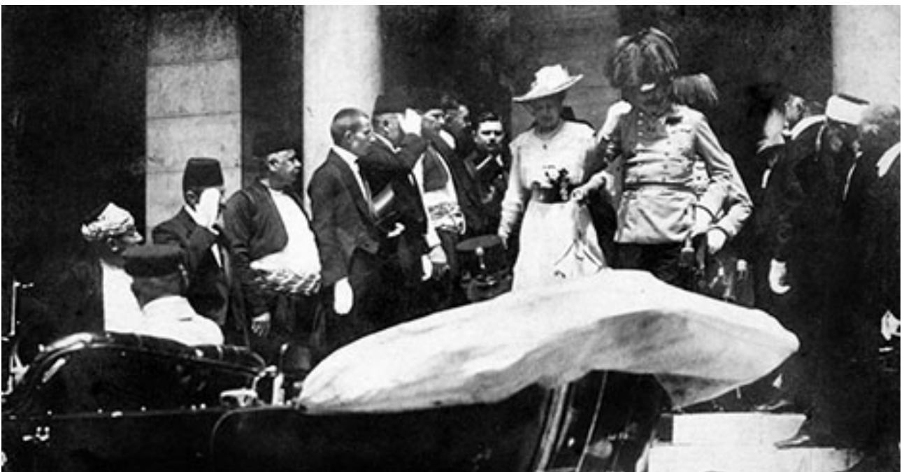
Franz Ferdinand och hans hustru Sophie på väg mot sin bil.

3. I början av kapitlet står det att Franz Ferdinand och hans hustru Sophie inte tänkte gömma sig, att de satte sig i en öppen bil som en markering mot sina kritiker. Fundera över vilka anledningar man kan ha till att vilja åka i en öppen bil. Lista så många ni kan komma på, det spelar inte någon roll hur trovärdiga de är i just det här fallet. När ni tömt ut alla möjligheter, titta på listan och fundera över om ni har hittat någon förklaring som är minst lika rimlig som bokens.